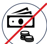
Kein Geldverkehr Geldautomaten, Kassen