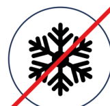
Keine Kühlung Kühlschränke sowohl privat als auch im Handel