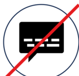
Keine Kommunikation Handy, Internet, Telefon, Notruf