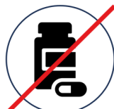
Keine Medikamente Apotheken