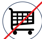
Kein Einkauf Nahrungsmittel, Treibstoff