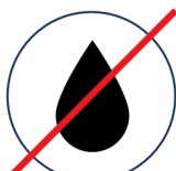
Kein fließend Wasser Sowohl Trinkwasser als auch Abwasser